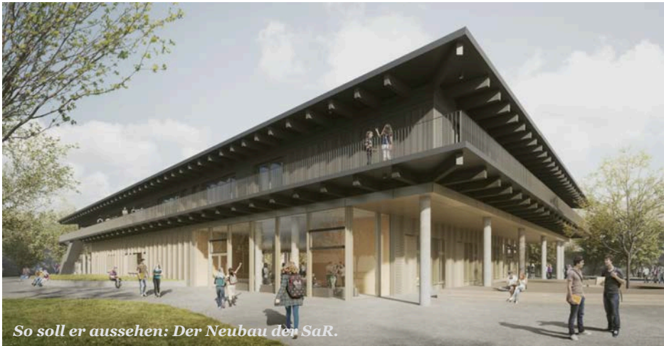
So soll er aussehen: Der Neubau der SaR.